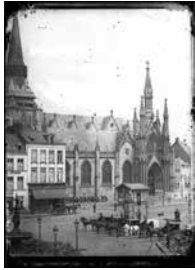
Anonyme Vue de l'église Saint-Martin sur la Grand Place de Roubaix et calèches, après 1863 - avant 1911 Tirage argentique sur verre 18 x 13 cm Don Véronique Crombé en mémoire de ses parents Jules-Philippe et Renée