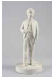
François Willème 1830, Sedan - 1905, Roubaix Le Prince impérial, vers 1867 Statuette représentant Louis-Napoléon Bonaparte (1856-1879) en pied Photosculpture. Biscuit H. 33 cm Don du Cercle des Entreprises Mécènes de La Piscine en 2022