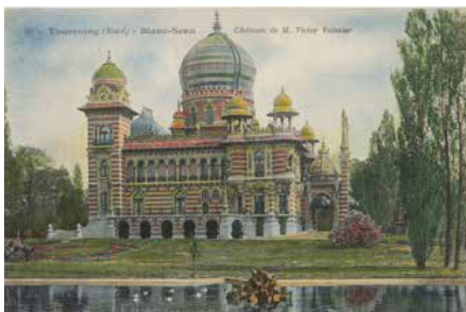
Château de Victor Vaissier Carte postale 10,5 x 14,8 cm Don de la Société des amis du musée en 2014

La révolution industrielle transforme profondément Roubaix : usines, cheminées et filatures redessinent la ville. La photographie accompagne cet essor textile en documentant les lieux de production, les machines et les gestes du travail. Souvent commandées par les industriels, ces images diffusent une vision valorisée du progrès économique et technique à travers albums, publications ou cartes postales. Avec le temps, les regards évoluent : aux représentations célébrant l'usine succèdent des approches plus humaines et sociales, attentives au monde ouvrier. Entre document, outil de communication et regard artistique, ces photographies témoignent autant de la puissance industrielle de Roubaix que de la mémoire des femmes et des hommes qui ont fait vivre ces usines.