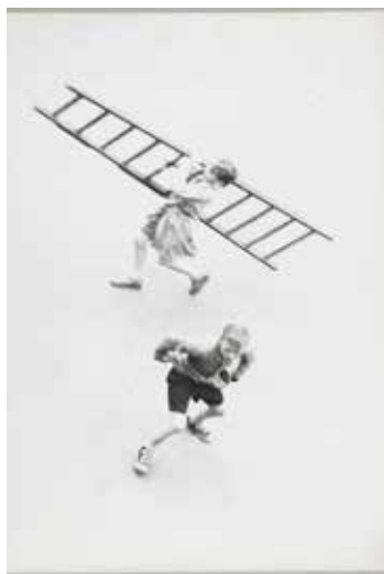
Achille Vilquin 1905 – 1981 Mimes , vers 1956 Tirage gélatino-argentique sur papier 40 x 30,3 cm Don Plays-Vilquin en 2002

À son apparition au XIX e siècle, la photographie révolutionne l'art du portrait. Longtemps réservé aux ateliers photographiques, le portrait se démocratise avec le portrait-carte puis la photographie amateur, permettant à toutes les classes sociales de fixer et transmettre leur image. À Roubaix, ces portraits accompagnent les grandes étapes de la vie et témoignent des transformations de la société. Ouvriers, industriels, familles ou anonymes composent une galerie humaine où se croisent mémoire intime et histoire collective. Des poses solennelles des premiers studios aux attitudes plus spontanées, ces visages racontent l'évolution des pratiques photographiques et dessinent le portrait sensible d'une ville et de ses habitants.