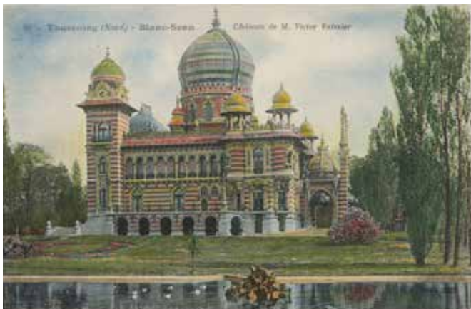
Anonyme Château de Victor Vaissier Carte postale. Héliotypie 10,5 x 14,8 cm Don de la Société des amis du musée en 2014