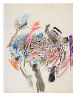
09. Mahjoub Ben Bella Nébuleuse b , 1970 Gouache et encre de Chine sur papier H. 65 ; L. 50 cm Collection particulière.