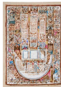
03. Mahjoub Ben Bella Thai III , 2002 Acrylique, aquarelle et encre de Chine sur papier thaï H. 79 ; L. 55 cm Collection particulière.