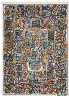
01. Mahjoub Ben Bella Sans titre , 2008 Eau-forte rehaussée à l'aquarelle et à l'encre sur papier, H. 35 ; L. 33 cm Collection particulière.