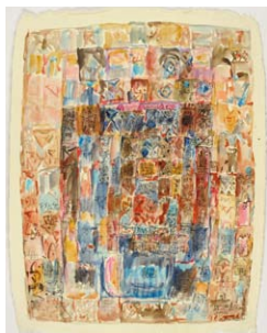
04. Mahjoub Ben Bella Maya , 2009 Acrylique, aquarelle et encre sur papier Népal H. 88 ; L. 68 cm Collection particulière.