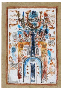
02. Mahjoub Ben Bella Sans titre , 2004 Gouache et encre sur papier thaï, H. 39,5 ; L. 27,5 cm Collection particulière.