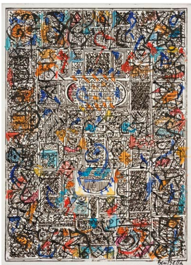
Mahjoub Ben Bella, Sans titre, 2008 Eau-forte réhaussée sur papier, H. 35 ; L. 33 cm Collection particulière.

Depuis 1996, le musée de Roubaix a mené plusieurs projets avec Mahjoub Ben Bella. Cette nouvelle aventure est une proposition qui, dans la diversité des techniques, des périodes et des supports présentés, suscite une autre émotion et une autre connaissance d'un artiste dont les racines ont superbement nourri, depuis son arrivée à Tourcoing en 1965, le paysage esthétique de notre région.