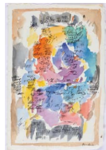
06. Mahjoub Ben Bella Oran , 2011 Aquarelle et encre de Chine sur papier Népal H. 23,5 ; L. 16 cm Collection particulière.