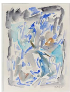
08. Mahjoub Ben Bella Méditerranée , 2012 Aquarelle et encre sur papier H. 60 ; L. 16 cm Collection particulière.