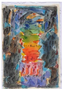
05. Mahjoub Ben Bella Oran , 2011 Aquarelle et encre sur papier H. 23,5 ; L. 16 cm Collection particulière.