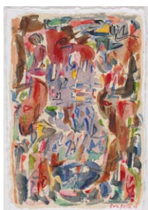
07. Mahjoub Ben Bella Oran , 2011 Aquarelle et encre de Chine sur papier Népal H. 23,5 ; L. 16 cm Collection particulière.