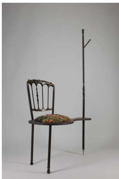
L'immigrée , 2013 Bois, broderies sur coton H. 156 x L. 85 x Pr. 40 cm

Les cinq œuvres exposées représentent une famille d'objets, expression des différents états d'une vie d'immigrant : les voyages, les souvenirs, les difficultés économiques, le maintien de l'intégrité tout en s'adaptant, les dissemblances entre la patrie et la terre adoptive. « Il s'agissait de créer une œuvre qui parle du lieu de naissance et du lieu d'adoption à travers les mémoires incarnées dans la matière. Ce qui est joli, dans ce migrant qui nous parle à travers les œuvres, c'est l'importance de sa richesse dans ce qu'il porte de vivant et non dans sa souffrance », précise Tal Waldman, plasticienne, designer et architecte, à l'origine du projet.