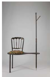
03. L'immigrée , 2013 Tal Waldman, Romain Maldague, Jennyfer Moret, Alain Nimsgern Bois, broderies sur coton H. 156 x L. 85 x Pr. 40 cm