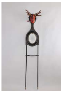
02. Identité interrogatoire , 2013 Tal Waldman, Romain Maldague, Jennyfer Moret, Philippe Moreau, Christine Bruckner Bois, métal, miroir, céramique, broderies sur coton H. 220 x L. 41 x Pr. 35 cm