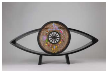
01. Entre deux terres , 2013 Tal Waldman, Romain Maldague, Pascal Frisa, Jennyfer Moret, Bois, cannage d'osier, broderies H. 66 x L. 131 x 25 cm