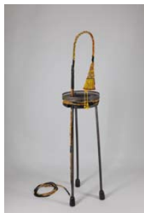
04. La travailleuse , 2013 Tal Waldman, Romain Maldague, Hubert Kerléo, Jennyfer Moret, Philippe Moreau Bois, métal, cordon textile, broderies sur coton H. 166 x L. 55 x Pr. 36 cm