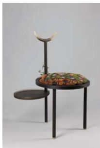
05. Tea Break , 2013 Tal Waldman, Romain Maldague, Jennyfer Moret, Alain Nimsgern Bois, corne, métal, broderies sur coton H. 75 x L. 43 x Pr. 40 cm