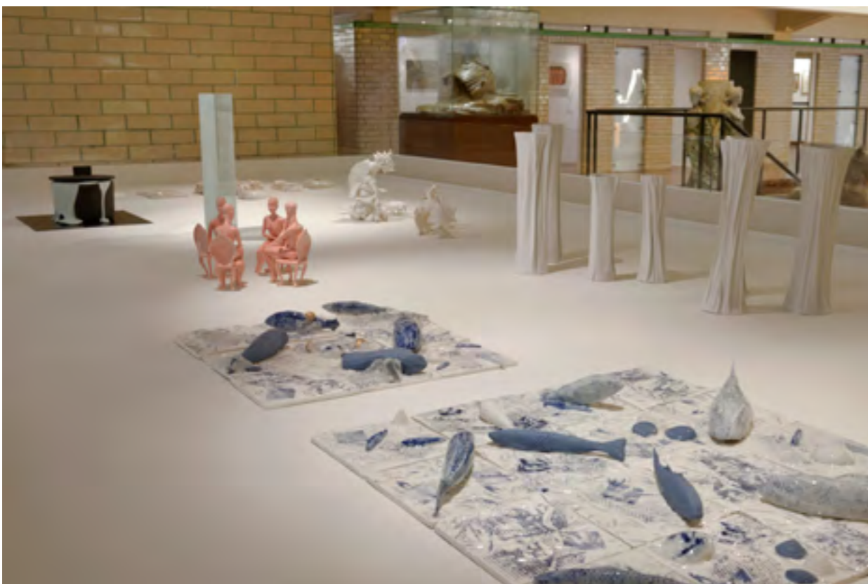
Vue de l'exposition Nage Libre au musée La Piscine.