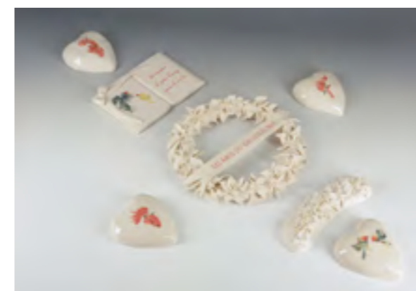
Safia HIJOS Née en 1975 Se souvenir des jours heureux , 2017 Porcelaine, décalcomanies