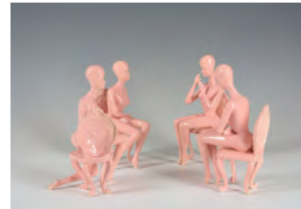
Myriam A. GOULET Née en 1988 The Consciousness Raising Group , 2017 Céramique émaillée, moulage et assemblage

20 octobre 2018 – 20 janvier 2019 / Roubaix – La Piscine