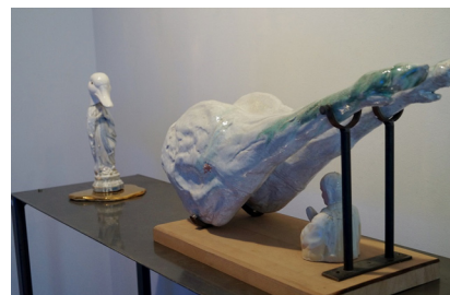
06. Yves Malfliet Altar 2 , 2015 Céramique, installation 140 x 45 cm