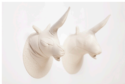
01. Caroline Andrin Licornes , 2014 Porcelaine coulée dans une paire de gants en cuir.