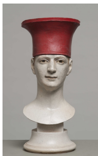
02. Philippe Brodzki La toque rouge 18 x 18 x H 40 cm