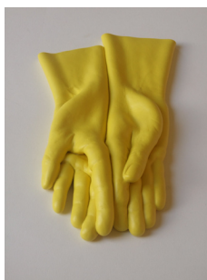
05. Anne Lenaerts Jaune , 2014 Pâte de coulage « porcelaine-fondant » colorée 4 x 26 x 12 cm