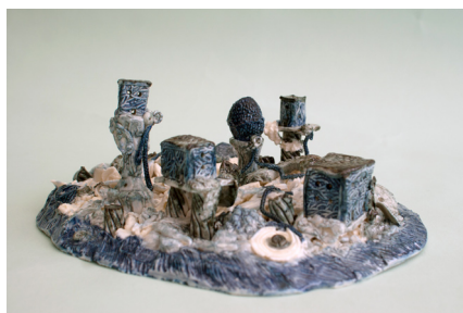
05. Vincent Kempnaers & Catherine Delbruyère Jardin de table (détail) , 2015