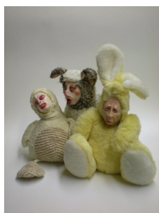
07. Peggy Wauters Orphans in a canapé Céramique, bois, peinture 90 x 175 x 75 cm