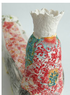
08. Fabienne Withofs Reine couchée , 2015 Porcelaine anglaise, décor transfert, engobe, pigments 1270° H34 x 50 x 14 cm