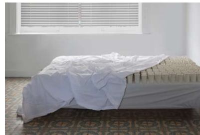
03. Virginie Besengez Insomnie , 2015. Porcelaine Installation, 140 x 160 cm